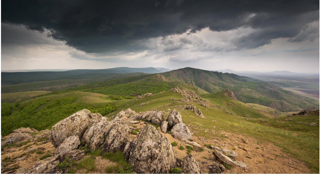
Parcul Național Munții Măcinului

https://romaniasalbatica.ro/ro/parc-national/muntii-macinului