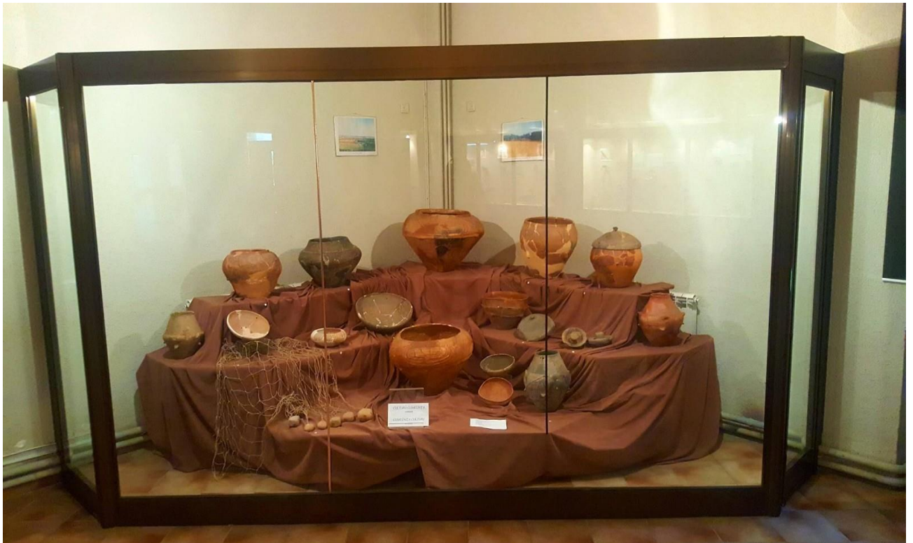
Muzeul de Istorie și Arheologie Tulcea

https://romaniasalbatica.ro/ro/parc-national/muntii-macinului