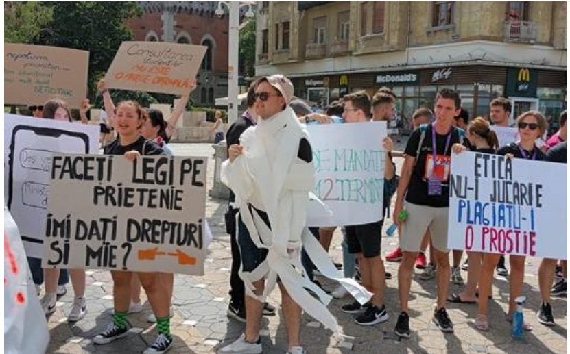
Figură 2 - sursa: https://www.opiniatimisoarei.ro/studenti-in-strada-la-timisoara-protest-fata-de-noua-lege-a-educatiei-ce-modificari-cer-tinerii-video/19/08/2022

Statisticile arată că nu stăm foarte bine la capitolul sănătate mentală fapt care poate fi foarte ușor explicat citând factorii de mai sus: mediul extern care este presărat de nesiguranță (pandemie, război, instabilitate financiară etc) și mediul intern care este constant sub semnul întrebării. Depresia este adeseori un răspuns firesc când simți că îți se încolăcesc gândurile, dar "optimismul realist" poate apărea ca un contra-răspuns. Generația noastră a fost creată ca să schimbe ceva în paradigma de gândire, ca să se oprească și să pună la îndoială tot ce se întâmplă în jur. Tehnologia și scepticismul ne-au fost date ca arme sociale, ca să putem aduce o schimbare. Nicio floare foarte frumoasă nu a crescut într-un loc curat precum gresia, ci a crescut în pământ jilav, iar "din nămol" apar și marile schimbări sociale. Revoluția de la 1989 nu s-a întâmplat pentru că erau oamenii bucușori, iar acum generația noastră urmează să facă schimbări majore la sistem (iar de multe ori deja o face de la vârste fragede). Trăim niște timpuri în care oamenii își pierd speranța că o să se mai schimbe ceva, iar generația mea găsește puterea să răspundă la lipsa de speranță cu haz, cu proteste, cu planuri și dezbateri.